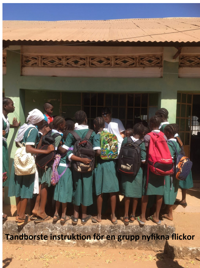
Tandborste instruktion för en grupp nyfikna flickor

Kom ihåg att betala in medlemsavgiften för 2020