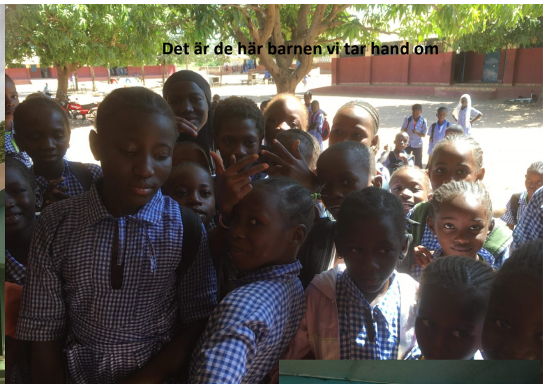
Det är de här barnen vi tar hand om