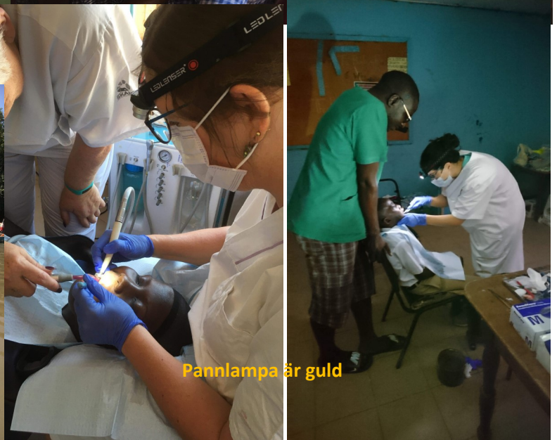
Pannlampa är guld