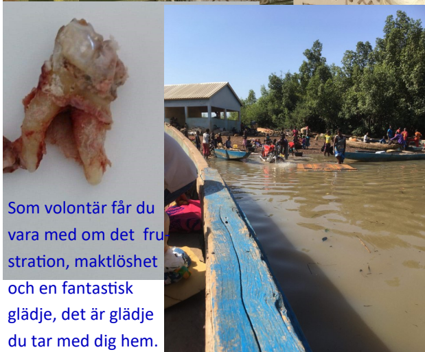
Som volontär får du vara med om det frustration, maktlöshet och en fantastisk glädje, det är glädje du tar med dig hem.