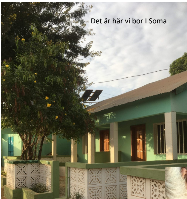
Det är här vi bor i Soma

info@afrikaadats.com ange namn, yrke, telefon nummer så ringer vi upp dig.