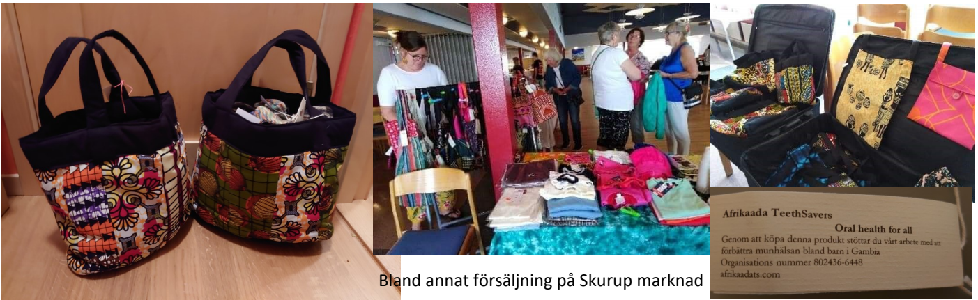
Bland annat försäljning på Skurup marknad